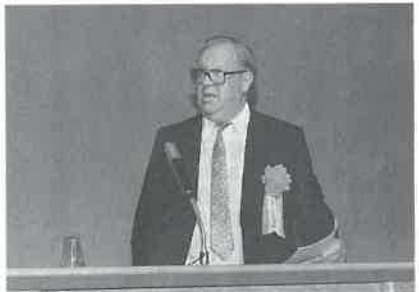
国際サウナ協会エイサロ会長の講演

第一回総会に続いて、アジアフォーラムが開かれ、中華民国、韓国から代表が参加。国際サウナ協会ア