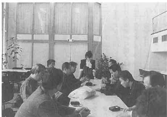
テルメ2000(オランダ)の会議室で説明を受けてから見学

まず感じたことは、アロマテラピー、タラソテラピーとか、医療、療養、それから予防医学といった方向に段々向かっている。サウナ部門も在来のサウナから、ちよっ