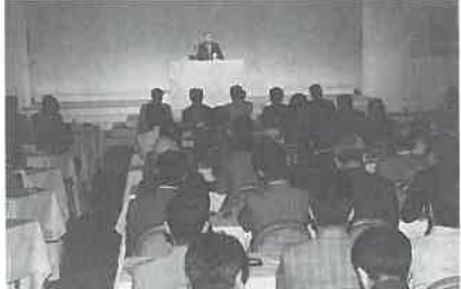
社団法人第1回総会は盛況のうちに……

第一回総会に続いて、アジアフォーラムが開かれ、中華民国、韓国から代表が参加。国際サウナ協会ア