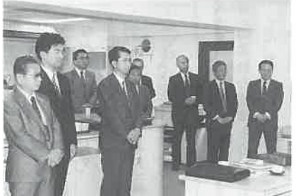
東京事務所のオープンセレモニー