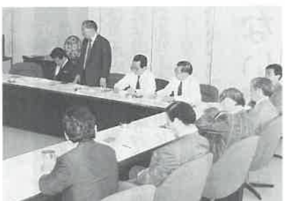
法人になって初の理事会(東京で)