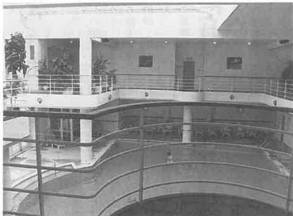
フィットメール(パリ)会員制の高級な施設でタラソテラピーを中心とする美容効果を売りにしている。センタープールでは水中体操の指導が行われる。フィットネスジムの設備も整っている