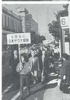
(写真上は賑わうチャリティ・バザール。左は街頭パレード)